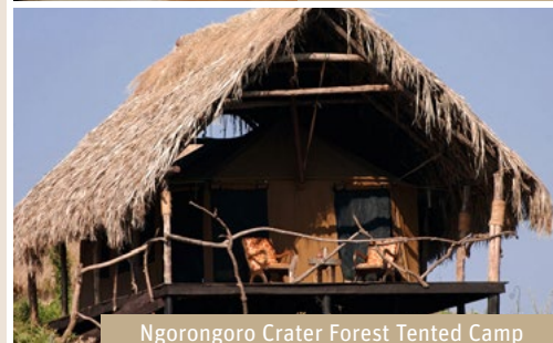
Ngorongoro Crater Forest Tented Camp