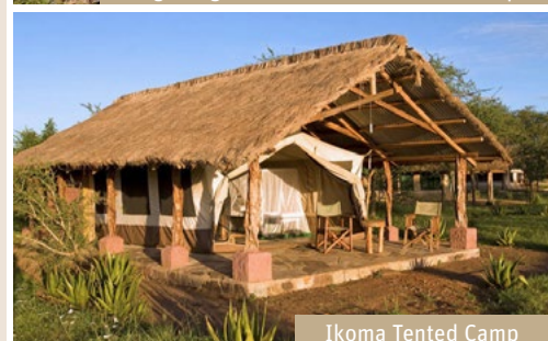
Ikoma Tented Camp